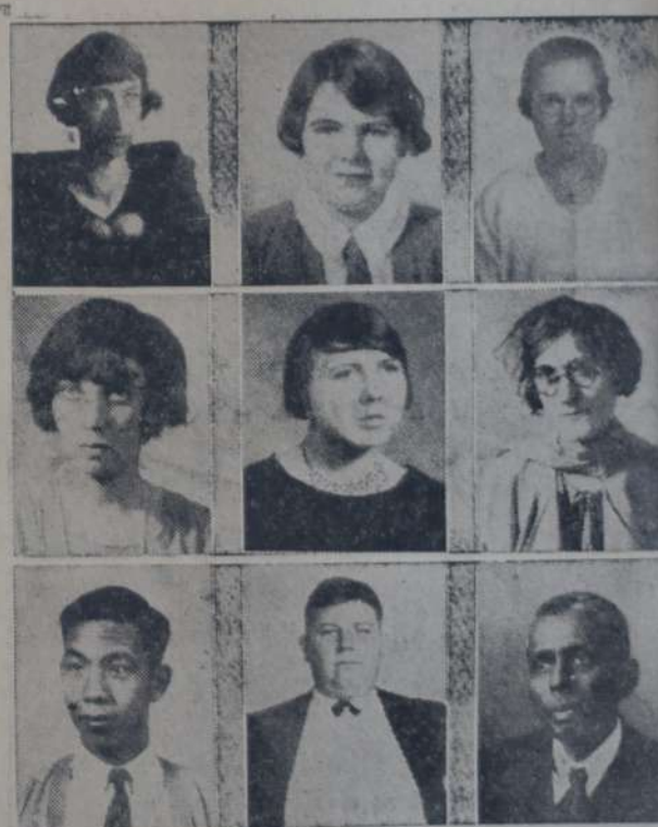
UN CONJUNTO DE ESTUDIANTES DE UNA UNIVERSIDAD NORTEAMERICANA entre los cuales se observan los tipos más diversos.