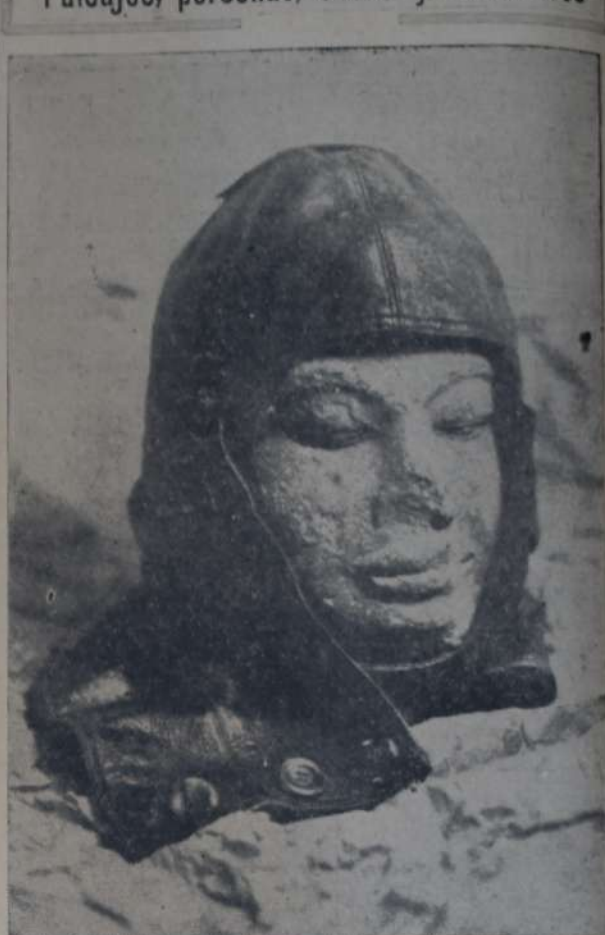
CURIOSO EFECTO QUE PRODUCE UNA CABEZA DE PIEDRA DE UN Buda de un templo de la India al cual se le ha aplicado el gorro de cuero de un aviador.