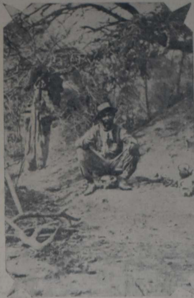
MIENTRAS FUNCIONARIOS COIMEROS Y GRANDES EMPRESAS CAPITALISTAS obtienen fabulosos rendimientos de la explotación forestal del Chaco, el hacendado criollo perdura en la miseria y explotación más inicua