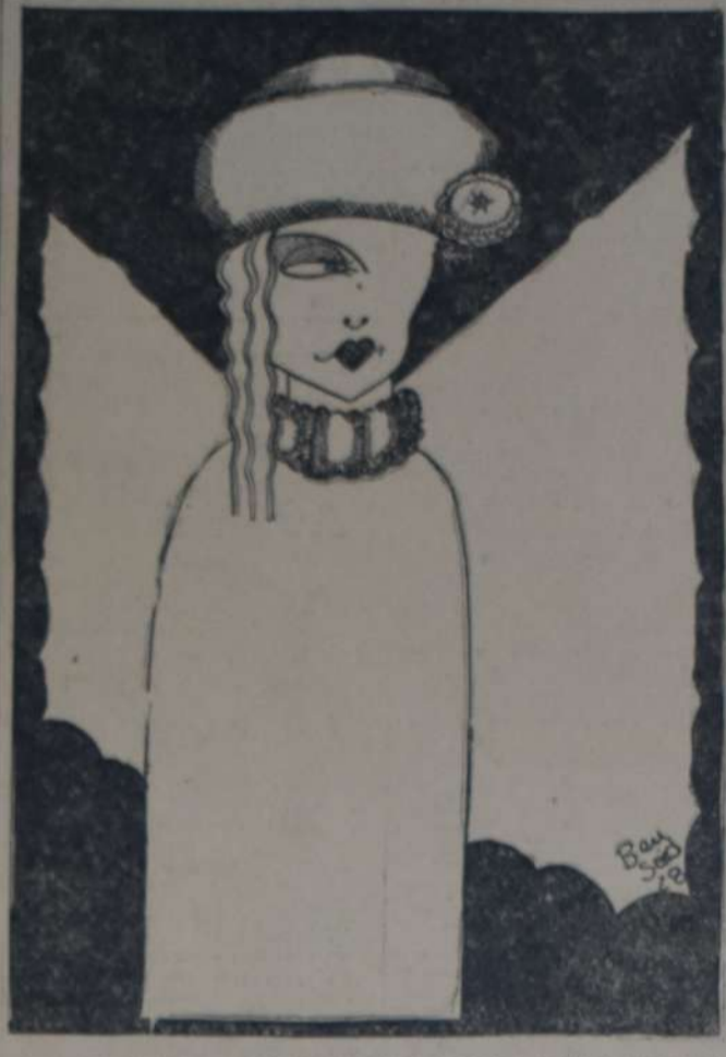
LA INTELIGENTE ACTRIZ CINEMATOGRAFICA LILIAN GISH DE quien, en la temporada próxima, Metro-Goldwyn-Mayer estrenará una película titulada "La rosa de los vientos".