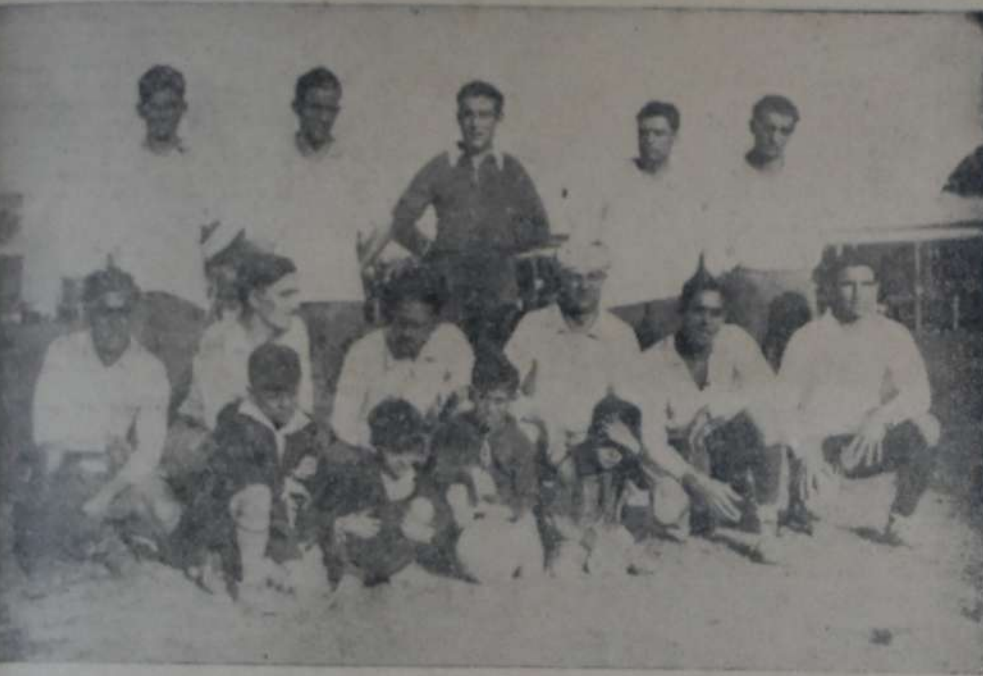
EQUIPO DEL C. A. LIBERAL ARGENTINO

Después del domingo anterior se había suspendido por ausencia del referee, y también el de Almagro y Estudiantil Porteño que por la misma causa quedó pendiente el 16 de diciembre ppdo.