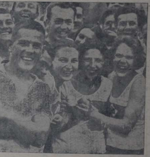
LA CONFRATERNIZACION DE HOMBRES Y MUJERES EN LOS campos deportivos de la nueva Rusia, es uno de los factores que más poderosamente ha contribuido a desvanecer viejos prejuicios en la vida de relación de ambos sexos.

Se ha extinguido la música. Un lindero rostro, en el que hacen cejas pintadas con Rimmel, se vuelve a nuestro lado hacia un americano. Arrullo eslavo en el que se funden las duras sílabas inglesas. Ella pretende encontrarlo tan bello, tan vigoroso a este