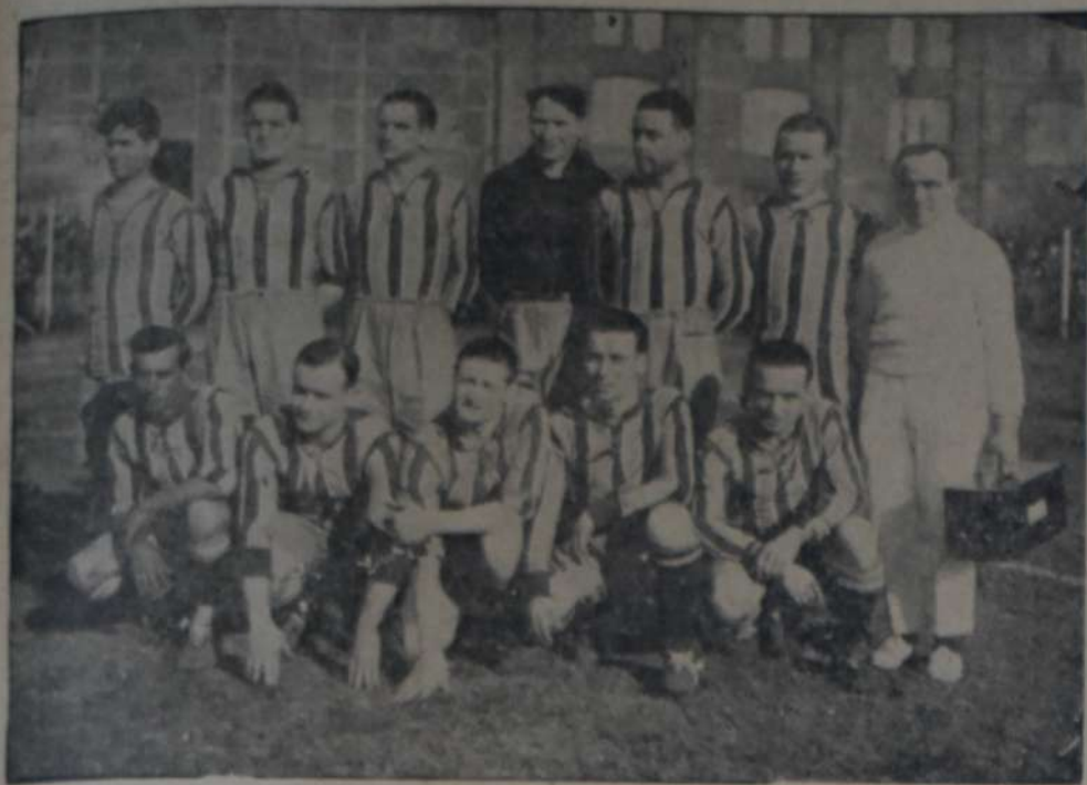
CONJUNTO DEL C. A. ALMAGRO

Se realizarán hoy tres partidos por el campeonato de primera división de la A. A. A.